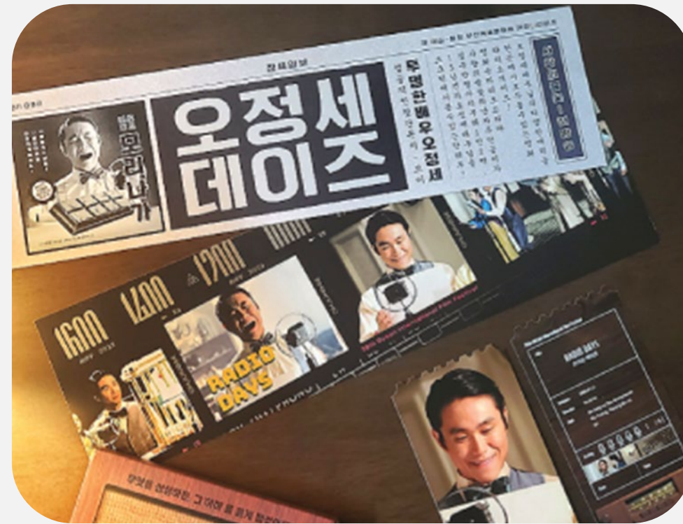
'굿즈 세트' 내 배우 다양한 매력 포착!