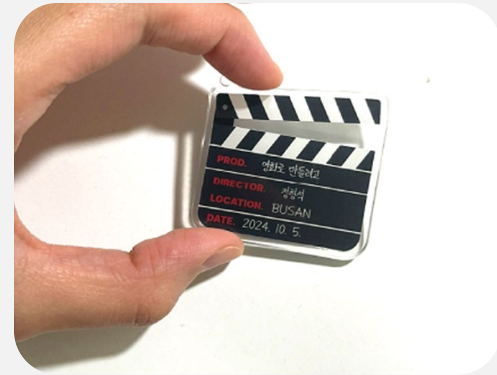
'디자인 배지' 영화인이 전하는 영화로운 일상 배지