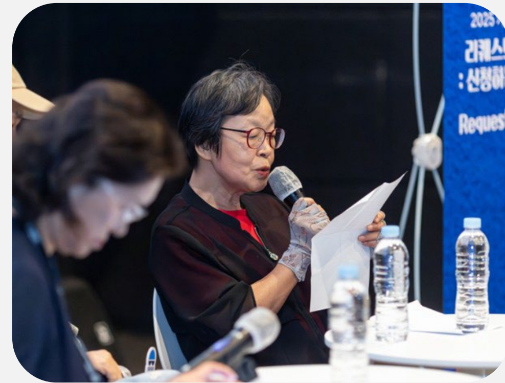
문학이라는 팔자를 사랑한 〈시인들의 창〉