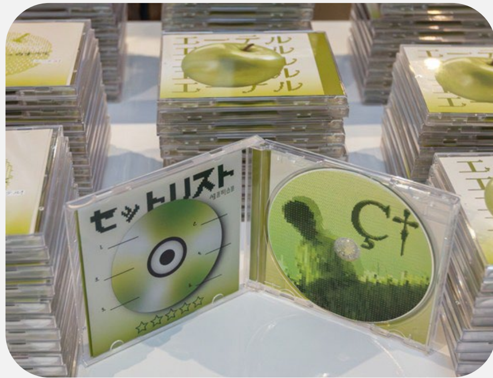
'디자인 공CD' 〈릴리 슈슈의 모든 것〉