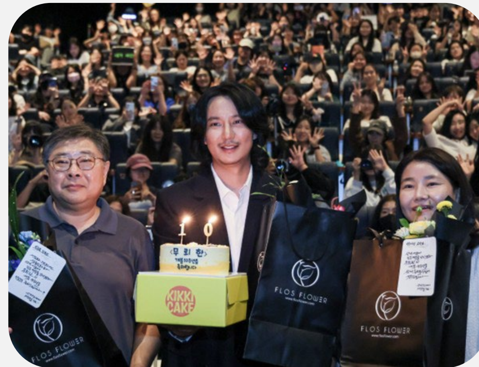
사랑은 계획에 없었다 〈무리한〉

[GV 게스트와의 만남] 이명세 감독, 강동원·하지원 배우가 함께 하는 20주년 특별상영