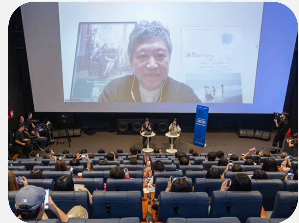
우리의 바닷마을 이야기 〈바닷마을 다이어리〉

[GV 게스트와의 만남] 오승욱 감독, 김남길 배우, 모더레이터 박지선 교수가 함께하는 관객과의 만남