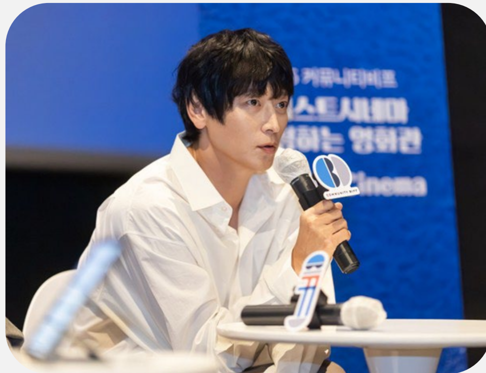
가을의 전설 - 형사 〈형사 Duelist〉

[GV 게스트와의 만남] 이명세 감독, 강동원·하지원 배우가 함께 하는 20주년 특별상영