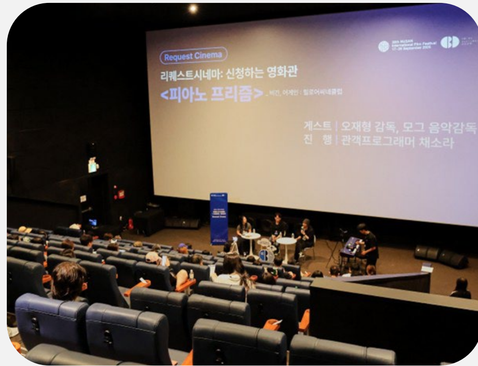
피아노 프리즘 〈비긴, 어게인〉

[GV, 라이브 드로잉] 콰야의 라이브드로잉으로 들여다 보는 영화 속 장면