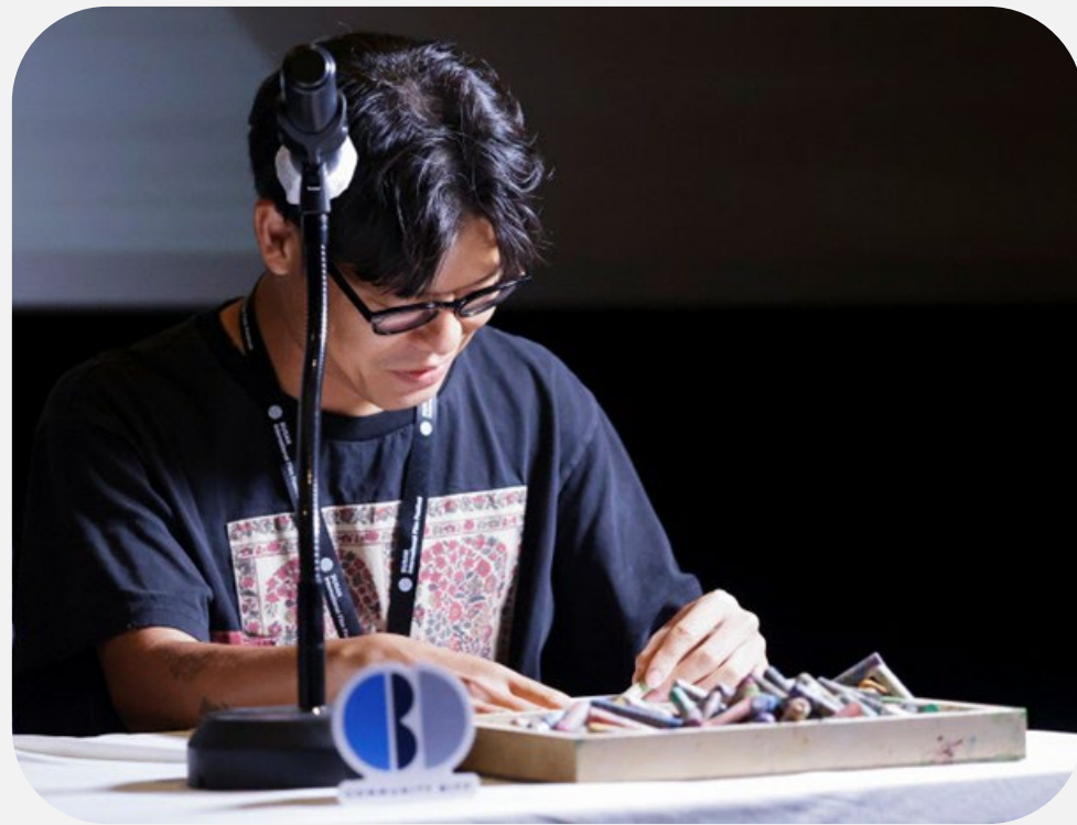
찬실이가 콰야에게 준 선물 〈찬실이는 복도 많지〉

[GV, 라이브 드로잉] 콰야의 라이브드로잉으로 들여다 보는 영화 속 장면